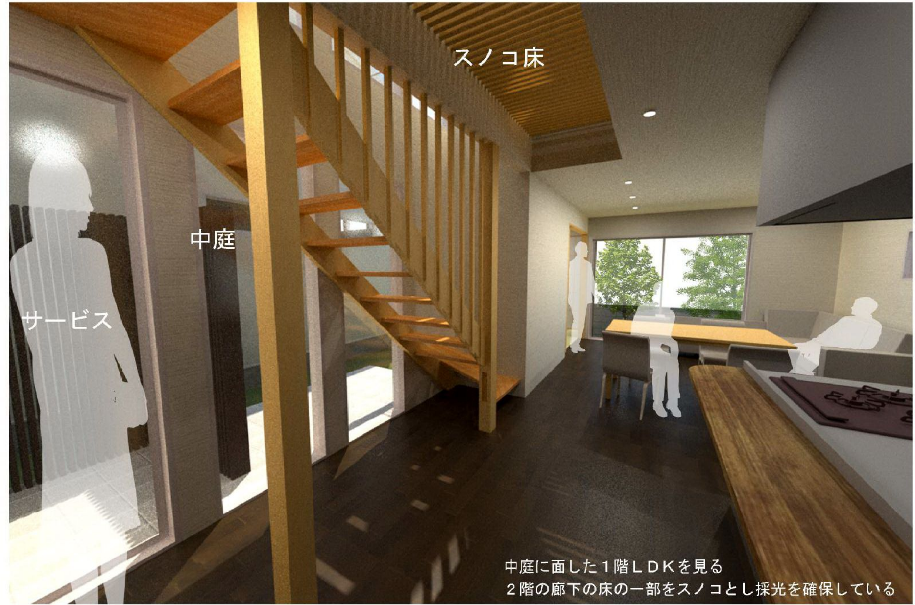
中庭に面した1階LDKを見る 2階の廊下の床の一部をスノコとし採光を確保している

中庭と中庭に面した階段を中心に住空間を連続させ明るく開放的な住空間としている。2階の廊下の一部をスノコ床として採光を確保している