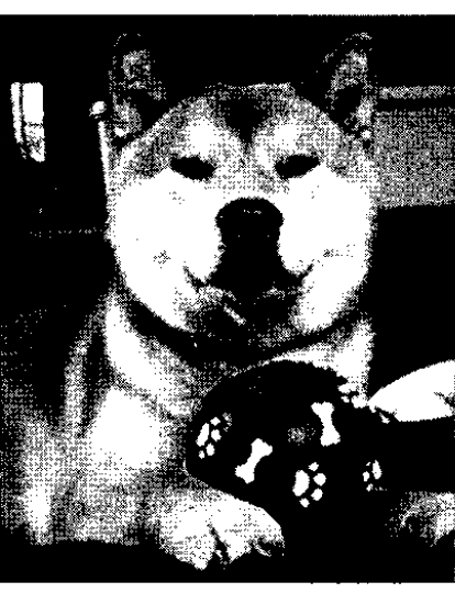
私の一枚 ペットコース

野茂投手は何度も解雇されたが、はい上がってきただ。最近の世相を見ると、何事でもすぐあきらめてしまふ人が多い。野茂投手のあくなき挑戦の姿勢を若者たちに学んでほしい。