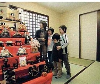
来客時に便利な個室の和室は落ち着いた佇まい。四季折々の行事をゆったりと楽しめる