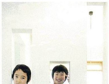
壁の仕切りにもひと工夫。遊び心溢れる長方形の穴から顔を覗かせ、子どもたちも大はしゃぎ