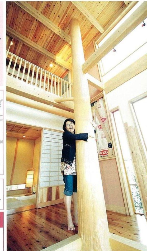
シンプルモダンな外観とは対照的に、ダイナミックな天然無垢材の造形で構成された玄関ホール。一本物の綾杉を用いた大黒柱はまさに圧巻

自然素材の安らぎと先進設備の快適性を表現 創業以来一貫して木の家にこだわってきた同社の代表的な住まいが「でっかい大黒柱のある家」。重厚感のある大黒柱や梁、建具や階段から構成され、暮らしの安心をしっかりと支えてくれる。また、体に優しい天然無垢材を、床や腰板、天井など、至る所に採用。素足に心地よい感触と豊かな香りも、ぜひご自身で体感して欲しい。