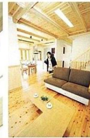
リビングダイニングはゆりの24畳