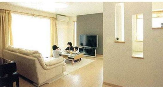
南側に面したリビングは採光も十分。住まい全体の断熱性能が優れているから、大空間をエアコン1台で暖められ、電気代を節約できる