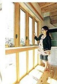
暖かな陽光が降り注ぐ明るい空間を演出