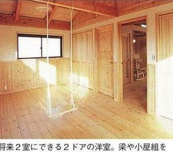
将来2室にできる2ドアの洋室。梁や小屋組を見せた現しの手法で、ダイナミックな雰囲気

天然無垢材に包まれた家 自然素材の快適さを体感 構造材も内装材も天然の無垢の木。壁や天井も珪藻土などの自然素材だから、ホルムアルデヒドの発生が抑えられる。自然の恩恵を大切にしたい、人に優しい住まいだ。買入物を兼ねて家族でご見学を。