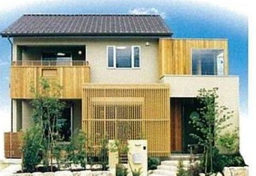
日本の伝統的な家づくりの要素を取り入れながら、都市の街並みにもしっくり馴染む外観

自然素材の安らぎと先進設備の快適性を表現 創業以来一貫して木の家にこだわってきた同社の代表的な住まいが「でっかい大黒柱のある家」。重厚感のある大黒柱や梁、建具や階段から構成され、暮らしの安心をしっかりと支えてくれる。また、体に優しい天然無垢材を、床や腰板、天井など、至る所に採用。素足に心地よい感触と豊かな香りも、ぜひご自身で体感して欲しい。