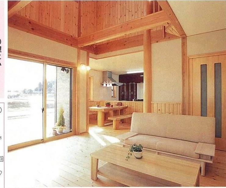
天然無垢材をふんだんに使い、壁や天井は調湿性に優れた珪藻土で仕上げたリビングダイニング。自然光をたっぷり取り込み、風が流れる設計だ。家具も無垢材で〈夢ハウス〉オリジナル