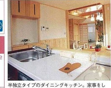
半独立タイプのダイニングキッチン。家事をしながら、連続するリビングや和室を見通せる

トリカイホーム 鳥飼建設 (株) 〒841-0204 佐賀県三養基郡基山町宮浦991-2 ☎0942-92-2020 http://www.torikaiken.co.jp/