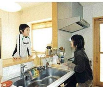
対面式のキッチンでは、子どもとのコミュニケーションを図りながら毎日の料理を楽しめる