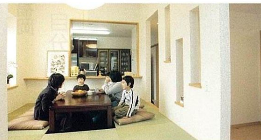
足を伸ばして寛げる掘り炬燵は友人からも高評価。食後も子どもたちが席を立つことなく、家族団らんの時間を満喫できるという