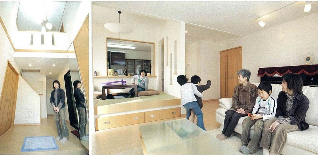
2000~2500円 家族が集うリビングダイニングは約22畳の広さ。大型家具を置いて遊び盛りの子どもが伸び伸びと過ごせるゆとりある空間が魅力だ。ソファだけでは家族5人が一緒に座れないからと、掘り炬燵を設えた小上がりの和室スペースも設置