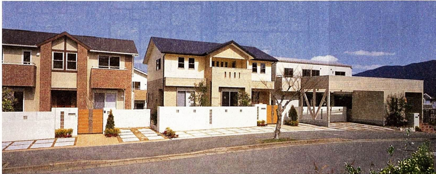
《貴船ガーデンヒル》に広がる美しい街並み。すでに約265世帯 (平成20年2月現在) が暮らす成熟の街である (既分譲区画で平成20年2月撮影)