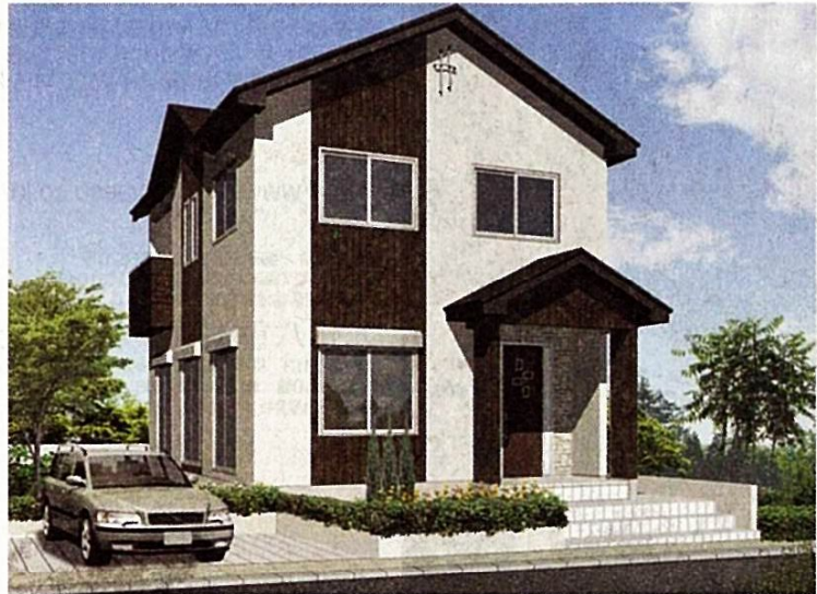
ツートンカラーのスタイリッシュな外観 (16-1号地完成予想図)

■16-1号地 4LDK 価格/2580万円 土地面積/209.84㎡ (63.47坪) 建物面積/104.75㎡ (31.68坪) ※車は価格に含まれません