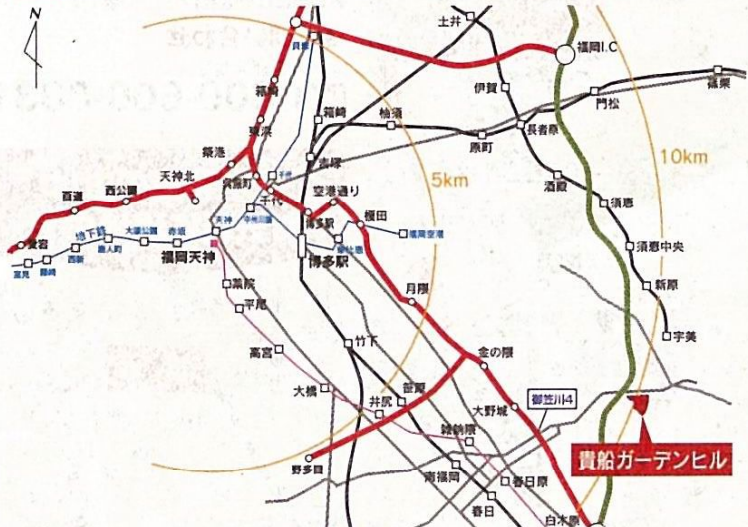
天神まで10km圏内。都市高速で約19分の軽快なネットワーク