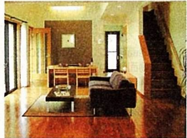
リビングは吹抜けがある大空間 ※1