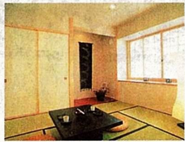
応接間として便利な2面採光の和室