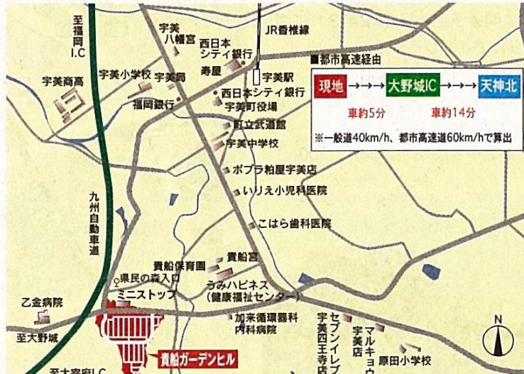
現地総合案内所/カーナビ入力は福岡県粕屋郡宇美町貴船5-16-15